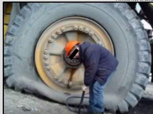
Nooitvree in actie

Dat onze Hopman niet meer "de jongste is" zal voor insiders duidelijk zijn. Dat hij snel "achter de adem raakt" bij inspanning is ook niet iets waarvan men opkijkt. Wat wel bijzonder is dat hij tijdens het oppompen van een "simpele" band "total loss" raakte. "Tjonge jonge, wat een verschrikkelijk klus zo'n band oppompen" hijgde en piepte Nooitvree na drie kwartier pompen. Uiteindelijk heeft het meer dan 8 en een half uur geduurd voordat onze Hopman het pompen opgaf. Toen we polshoogte gingen nemen, en de band die moest worden opgepompt zagen met eigen ogen, begrepen we waarom hij zo mopperde en het uiteindelijk opgaf. Geef hem eens ongelijk!